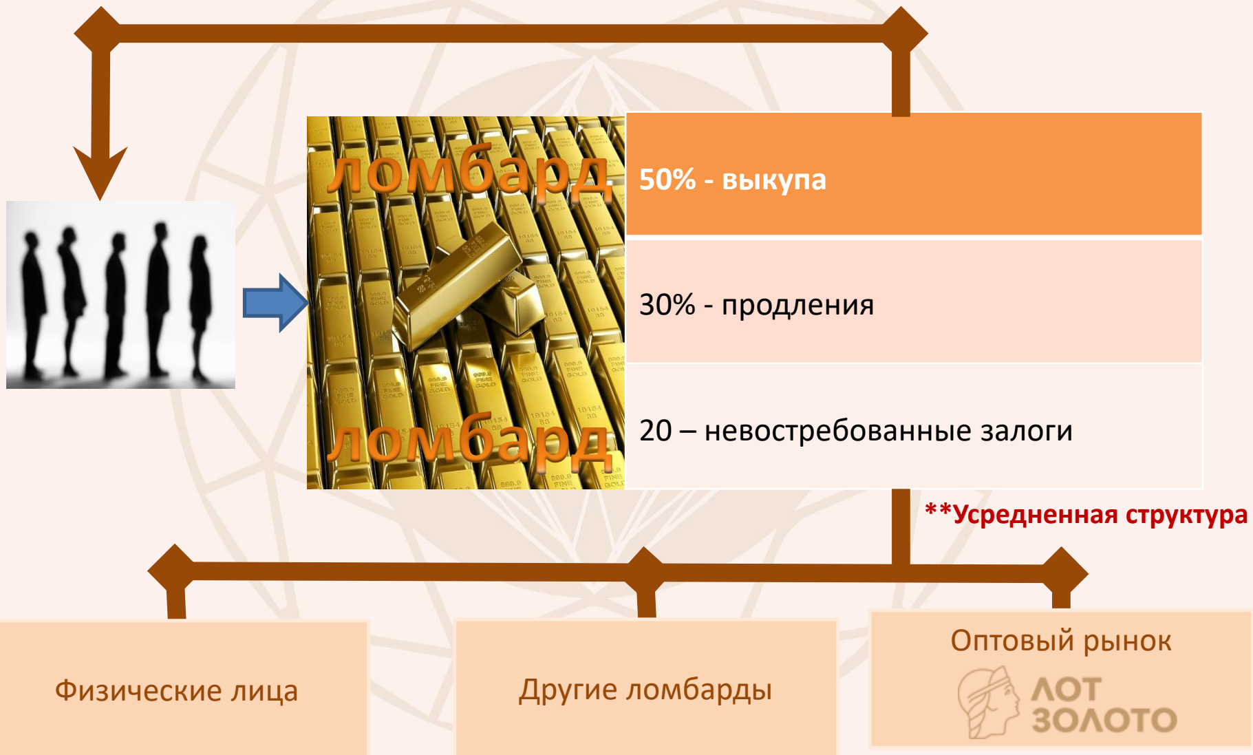
Схема работы ювелирного ломбарда